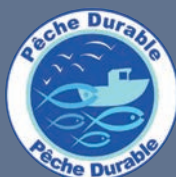
LES PRODUITS ISSUS DE LA PÊCHE MARITIME BÉNÉFICIAINT DE L'ÉCOLABEL PÊCHE DURABLE

Les produits issus d'une exploitation bénéficiant de la certification environnementale de niveau 2 entrent également dans le décompte uniquement jusqu'au 31 décembre 2029.